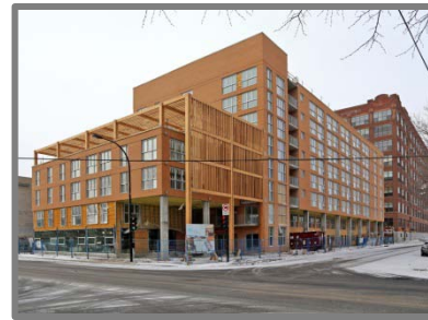
Projet Cité des Bâisseurs, Pointe-St-Charles, Montréal

Dans les milieux moins peuplés, l'habitation communautaire favorise la mixité sociale en retenant la population, en attirant de nouvelles familles et en offrant aux aînés la possibilité de vieillir dans leur communauté d'origine.