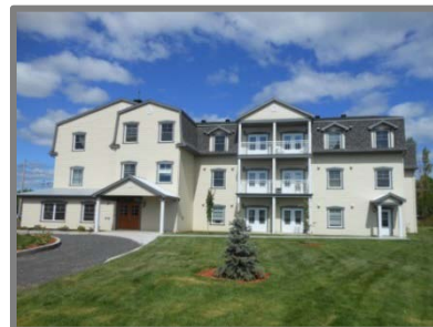
Maison St- Antoine-de-Tilly, Chaudière- Appalache

Les municipalités reconnaissent le logement social et communautaire comme partie prenante du développement local et des services de base à assurer à la population.